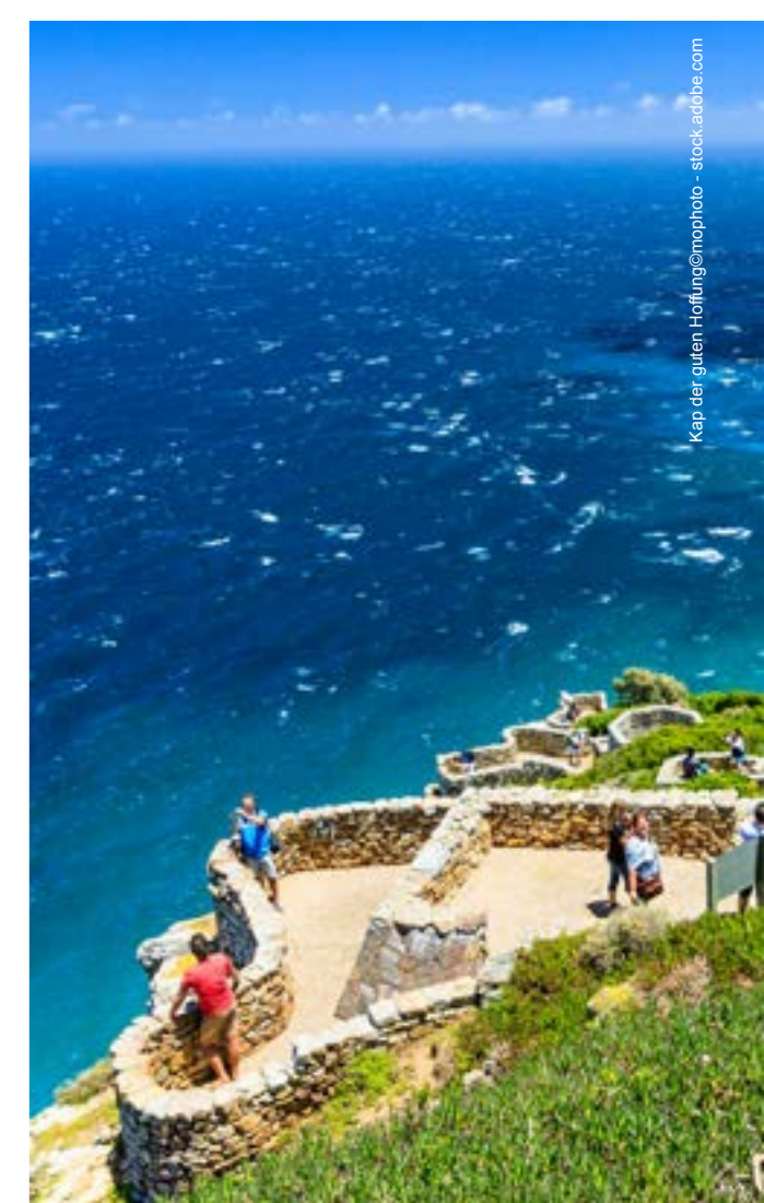
Kap der guten Hoffnung