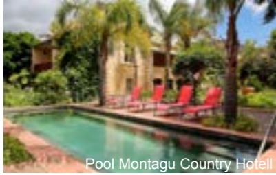
Pool Montagu Country Hotel

Das Hotel befindet sich 1 km vom Zentrum von Kapstadt. Im Umkreis von ca. 500m befinden sich das Parlament, das District Six Museum, die Nationalbibliothek und diverse Shopping Malls. Neben einem Blick über die Stadt verfügen die Zimmer über einen individuellen Temperaturregler, TV, Safe, Kaffee- / Teekoher und ein Badezimmer Bad o. Dusche/WC und Fön. Außerdem verfügt das Hotel über ein Restaurant, eine Bar, einen Pool sowie WLAN.