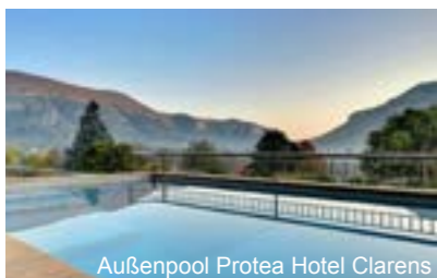
Außenpool Protea Hotel Clarens

Das Camp liegt zentral in den Drakensbergen und ist ein idealer Ausgangspunkt für ausgiebige Wanderungen wie zum Beispiel einer ca. halbstündigen Wanderung zu den Buschmannshöhlen oder zum Buschmannmuseum. Zum idyllischen Camp gehören ein Restaurant mit einer Bar, sowie 37 Chalets mit Bad/Dusche/WC, Küchenbereich, einem Grillplatz und einem Kamin.