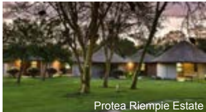
Protea Riempe Estate

Das Montagu Country Hotel an der Garden Route liegt eingebettet zwischen den Langeberg-Bergen des Western Cape. Das Dorf bietet eine perfekte Zwischenstation zwischen Kapstadt und der Garden Route. Genießen Sie den Service im Restaurant und die Atmosphäre der Region. Jedes der individuell eingerichteten Zimmer verfügt über Bad/Dusche und WC, eine Klimaanlage, kostenloses WLAN, TV und Kaffee- / Teekoher.