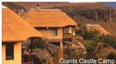
Giant's Castle Camp

Das Paxton Hotel mit Bar und Restaurant befindet sich in Port Elizabeth. Es liegt in der belebten Umgebung von Humewood in der Nähe des Stadtzentrums und bietet einen herrlichen Blick auf die Bucht von Algoa. Die hellen Zimmer verfügen über Bad/Dusche und WC, Fön, Klimaanlage, Safe, Fön, kostenlosem WLAN, TV, Safe und Kaffee- / Teekoher.