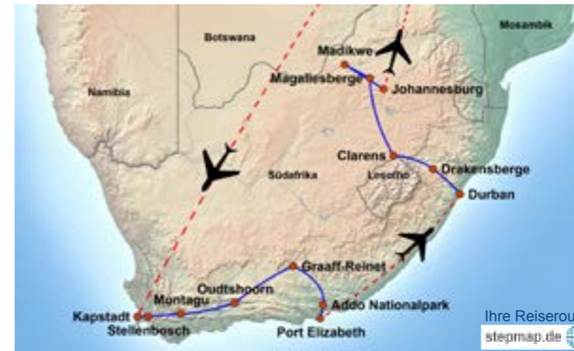
Ihre Reiseroute stepmap.de