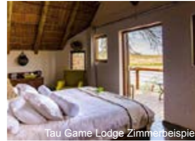
Tau Game Lodge Zimmerbeispiel

Die Mokoya Lodge befindet sich auf einer ehemaligen Farm, welche 1994 liebevoll zu einer Lodge umgebaut wurde. Die gemütliche Lodge verfügt über ein Restaurant und einen außen Pool. Jedes Zimmer ist ausgestattet mit einem Badezimmer mit Dusche/WC, Fön und Kaffee- / Teekoher. Teilweise verfügen die Zimmer auch über eine Klimaanlage.