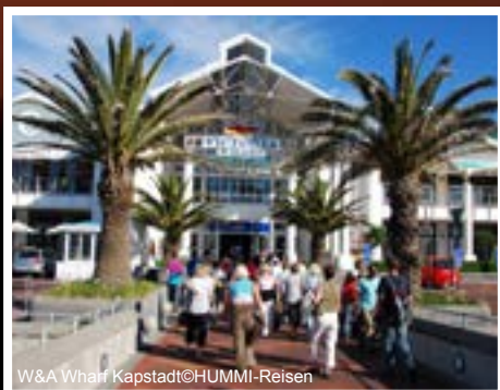
W&A Wharf Kapstadt