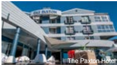
The Paxton Hotel

Die Kuzuko Lodge liegt auf einem Hügel mit Blick auf die Kaboega-Ebene und die Winterberge. Die 24 Chalets bieten den Gästen einen atemberaubenden Blick auf ein großes Reservat, ein Wasserloch und die Ebenen der afrikanischen Klein Karoo. Ausstattung Zimmer: Bad/Dusche und WC sowie Fön, WLAN, Adapter, Safe, TV und einer Klimaanlage.